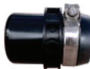
Tapón Final FXN