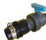
Válvula de Descarga

*Todos los conectores se entregan como kit (con abrazadera y su propio empaque) *En los conectores para Flexnet de 6" la apariencia puede cambiar